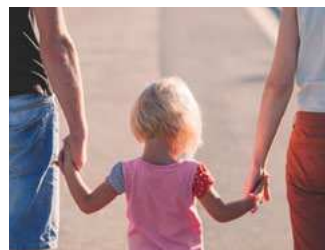
7 Overige en eerder aangekondigde maatregelen

Dit document bevat voorstellen van het kabinet die de komende periode in het parlement worden behandeld. De voorgestelde maatregelen treden per 1 januari 2021 in werking, tenzij anders is vermeld.