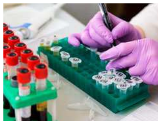
6 Vastlegging coronasteunmaatregelen