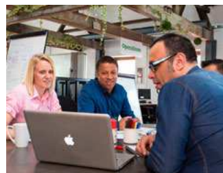
3 Ondernemers en ondernemingen