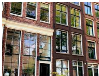
2 Onroerend goed