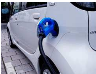
5 Vervoer en verduurzaming