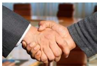
2 Wet arbeidsmarkt in balans (WAB)