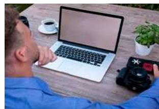
7 Varia Arbeidsrecht