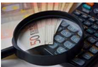
1 Varia loon- en premieheffing

Tevens bevat de special actuele cijfers en informatie over de nieuwe Wet arbeidsmarkt in balans, de auto van de zaak, de nieuwe fiscale regeling betreffende de fiets van de zaak, de WKR en de Wet compensatie transitievergoeding.