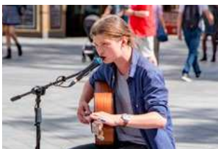
5 Wet tegemoetkomingen loondomein