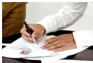
6 Wet DBA